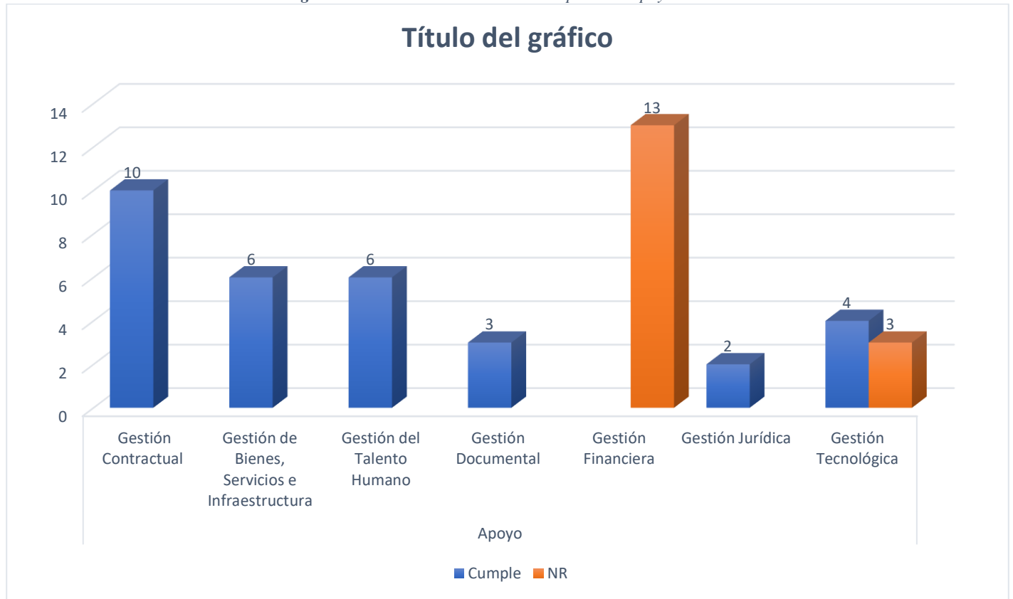
Figura 3. Estado actividades de control procesos apoyo