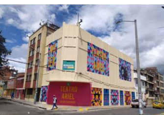
Intervención Calle 22