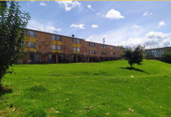
Predio Las Cruces